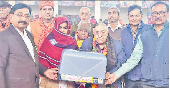
सोनीपत। जरूरतमंदों को सामान वितरित करते हुए समिति के पदाधिकारी एवं सदस्यगण।