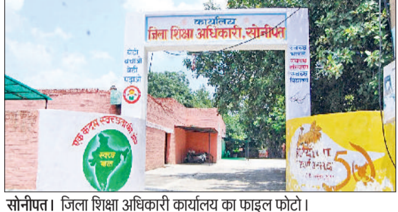
सोनीपत। जिला शिक्षा अधिकारी कार्यालय का फाइनल फोटो।