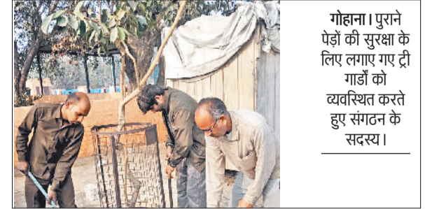
गोहाना। पुराने पेड़ों की सुरक्षा के लिए लगाए गए ट्री गाड़ों को व्यवस्थित करते हुए संगठन के सदस्य।