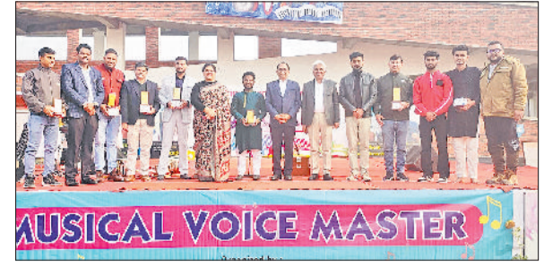
सोनीपत। कार्यक्रम के दौरान अतिथियों को सम्मानित करते हुए।